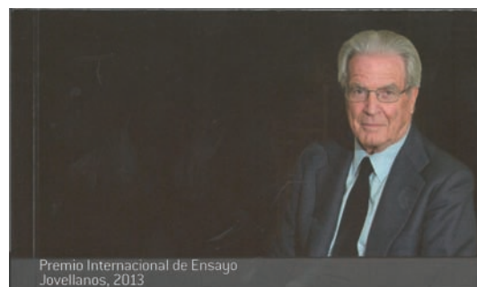
Antonio Garrigues Walker

La transició espanyola va ser una i van ser moltes, algunes d'elles poc analitzades fins al moment, potser amagades després de les transformacions polítiques. Des de la idea general aportada per l'autor que resulta "difícil trobar a escala global en la història recent un procés de transició més eficaç i positiu", Antonio Garrigues, a través de nombrosos escrits i conferències seues, tracta de posar en valor aquestes altres transicions interrelacionades entre si en un escenari polièdric i apassionant. I porta a terme, al mateix temps, l'autocrític exercici de mostrar el que ell mateix pensava llavors i el que finalment va ser. El seu recorregut analític entre 1956 i 1986 permet reviure, des d'una òptica més personal, episodis de gran transcendència en la recent història d'Espanya, com l'arribada de la multinacional Ford al nostre país, el cop d'estat del 23-F o "l'esplendorós fracàs" de l'Operació Reformista, un intent liberal per trencar el bipartidisme.