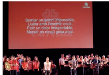
Concert al Teatre Victòria de presentació de Feina amb Cor, el servei d'acompanyament a l'ocupació per aturats de llarga durada