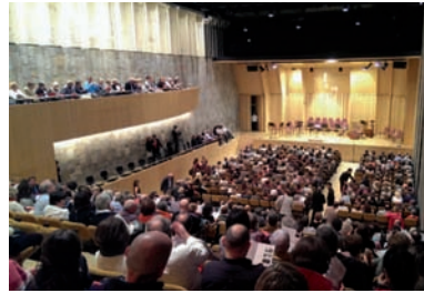
Més de 500 persones participen en el concert solidari Miserere en benefici de Càritas Diocesana de Barcelona, celebrat al Petit Palau, del Palau de la Música Catalana.