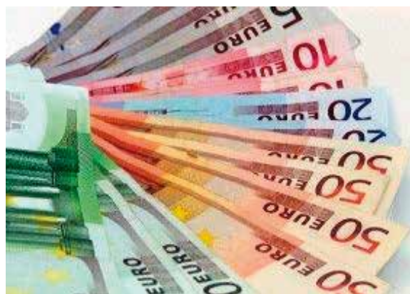
Base imposable de l'IRPF

Cal recordar que del 2007 a 2008, Espanya va veure com els seus ingressos fiscals es reduïen en 70.000 milions d'euros. En altres paraules, malgrat les nombroses pujades d'impostos que han posat al límit l'esforç de moltes famílies i empreses, més encara si tenim en compte els nivells de productivitat i competitivitat de la nostra economia, els ingressos fiscals segueixen sent insuficients. És més, aquest increment en els ingressos fiscals està estancat malgrat noves pujades i, fins hi tot, posa en risc els propis objectius de recaptació segons les dades empíriques que recull l'informe.