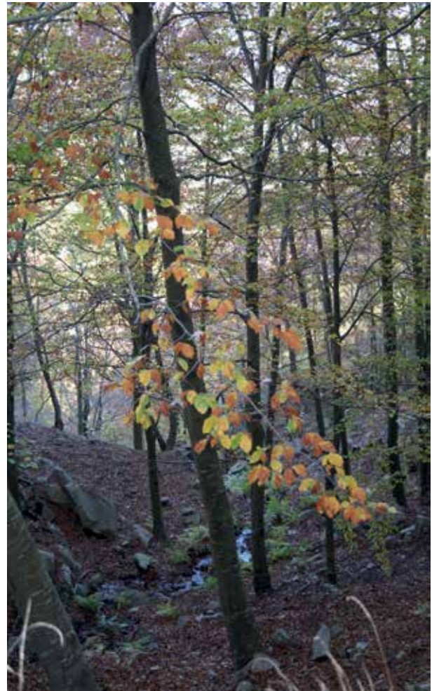
Bosc de la Selva.

Si una cosa tenen en comú aquestes propostes és que suposen un malbaratament dels recursos econòmics sense cap garantia certa de continuïtat en el temps. Un senzill problema en els pressupostos públics o els terminis de pagament i la dependència dels ajuts forestals esdevé crítica per l'empresari.