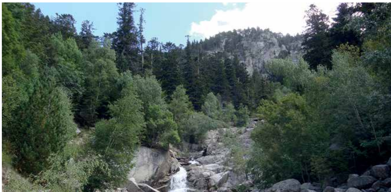
Bosc del Pallars.