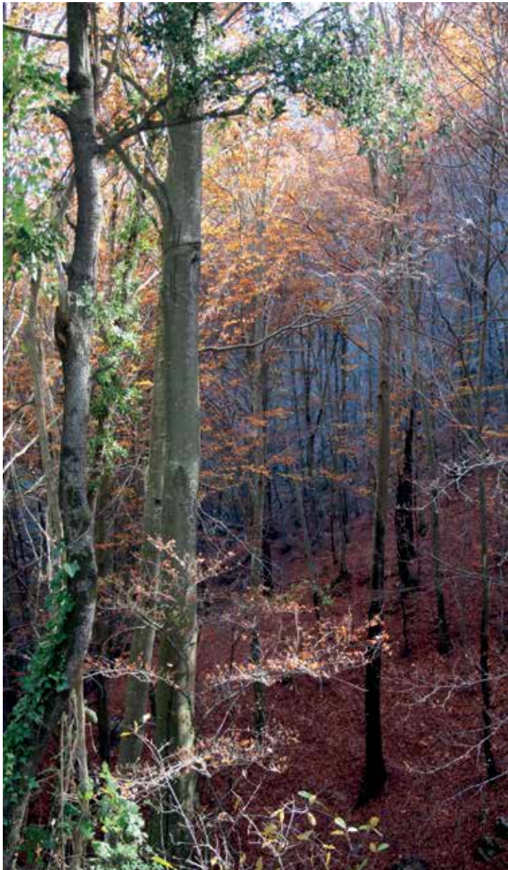
Bosc d'Osona.

Des de la celebració del II Congrés Forestal a Tarragona, el 2007, han conviscut a Catalunya diverses visions respecte a l'aprofitament dels recursos forestals i del bosc per part dels propietaris.