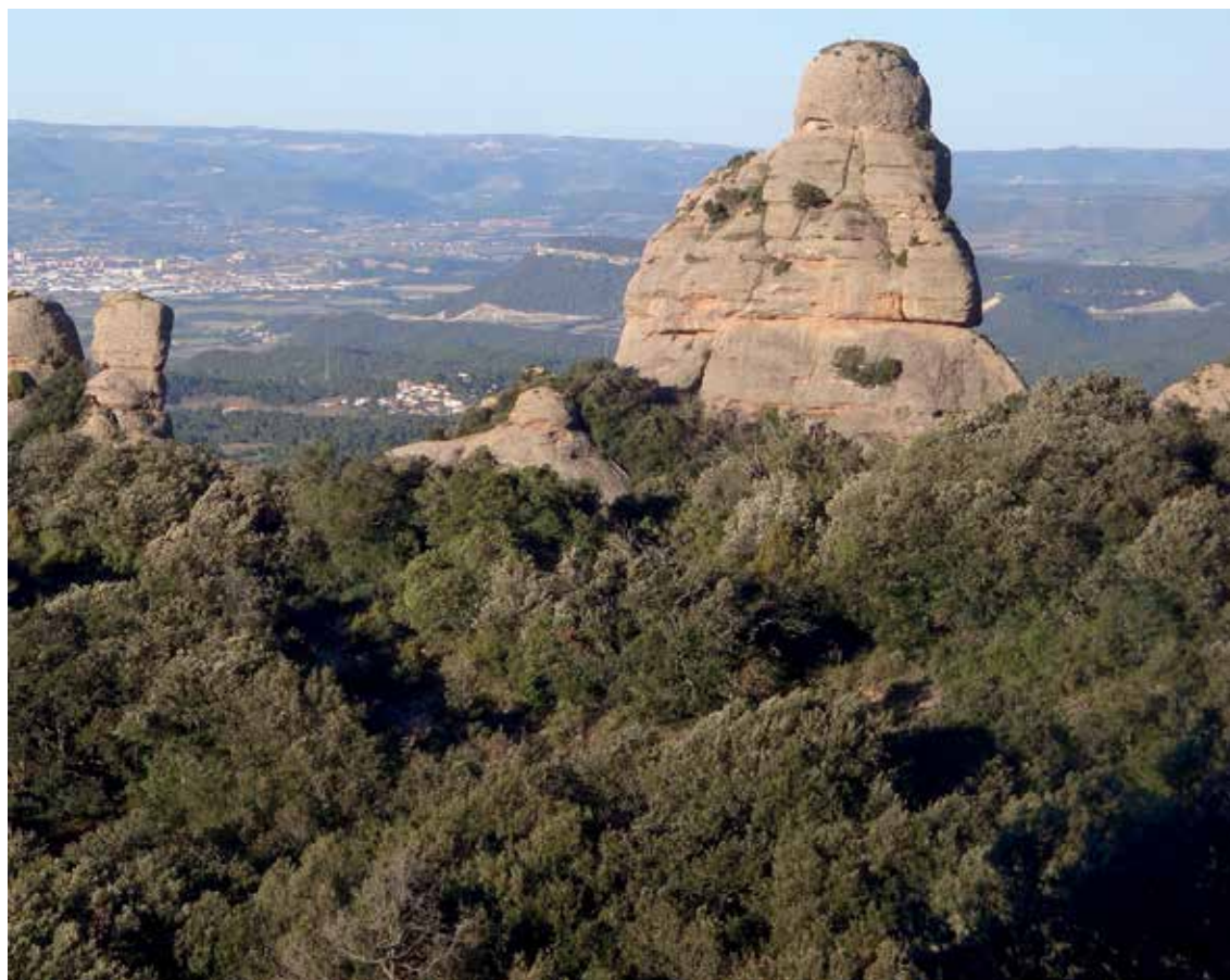
Bosc del Baix Llobregat.

Tot plegat impedeix un millor desenvolupament real dels negocis i sovint suposa un fre real a les inversions i a capital de fora del sector a qui aquestes restriccions i inseguretats genera dubtes raonables per no invertir.