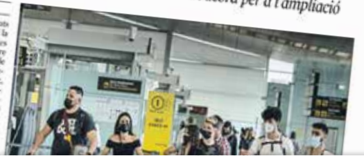
80 LA VANGUARDIA ECONOMIA

L'aeroport ajuda les nostres empreses, universitats, clíniques i hospitals, botigues, botigues, a tota l'economia. Un aeroport ben connectat fa venir turistes, milions més. Una empresa europea que plantja posar el seu centre d'investigació, amb persones de molts països, en contacte amb experts d'universitats internacionals i amb empreses proveïdores o distribuïdores, triaria una ciutat amb un aeroport ben connectat amb el món. Amb vols directes un científic podria sortir de Barcelona a les 9h del matí i anar a Boston a les 10 h, hora d'arribada. Podria assistir a un acte a Harvard amb un diàleg. Les reuni-