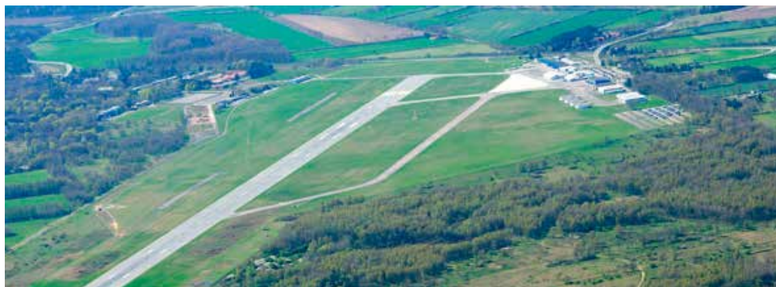
Aeroport de Lübeck

Per tant, és l'administració regional la que té la clau a l'hora de decidir si les compensacions que es proposen són suficients per superar l'avaluació ambiental, les quals en cap cas passen necessàriament per afectar més territori agrícola, sobre el qual s'està produint una contradicció evident en la política de la Generalitat (al mateix temps que està vigent una Llei d'Espais Agraris i un pla especial per al Parc Agrari de el Baix Llobregat, que se suposen que protegeixen l'activitat agrícola en el territori).