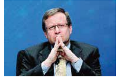
Koonin fue científico jefe del Departamento de Energía de EE.UU. con Obama.

Nacido en Brooklyn en 1951, Steven E. Koonin es un físico teórico, doctorado en el MIT y profesor en la NYU. En 2021 llamó la atención por dos motivos. El primero fue la publicación de un libro titulado No resuelto , en el que demuestra que la cuestión del clima, que la política y los medios consideran poco menos que una cosa juzgada nítida y definitivamente, está lejos de serlo. Según Koonin, no hay ninguna evidencia científica para asegurar que el mundo afronta una emergencia climática. El segundo motivo fue que el autor de este libro, que matiza considerablemente las proyecciones futuras sobre el cambio climático, fue el científico jefe del Departamento de Energía de Estados Unidos durante el Gobierno progresista de Barack Obama.