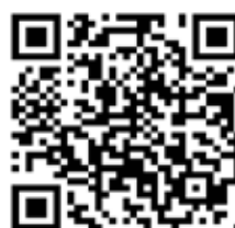
QR vídeo de la conferència