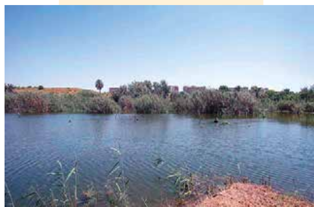
Clot de Galvany

Tenim molts exemples com el Clot de Galvany o Begudà , on l'activitat de regeneració està associada a la recàrrega d'aqüífers. Un altre exemple és la mateixa àrea metropolitana de Barcelona , on el subministrament d'aigua a través de la xarxa està avui en un 25% provinent d'aigua regenerada , i tot el que s'està fent en l'àmbit metropolità per a recàrrega d'aqüífers es fa des de fa més de 30 anys. I quan parlem d'Israel, on l'ús d'aigua regenerada és només per a reg, en el cas de Barcelona també per beure . És a dir, totes les tecnologies, la governança, la possibilitat de portar endavant tot l'àmbit de regeneració existeix, i tant és així, que ho estem posant en marxa, sense anar-nos més lluny, a l'àrea metropolitana de Barcelona.